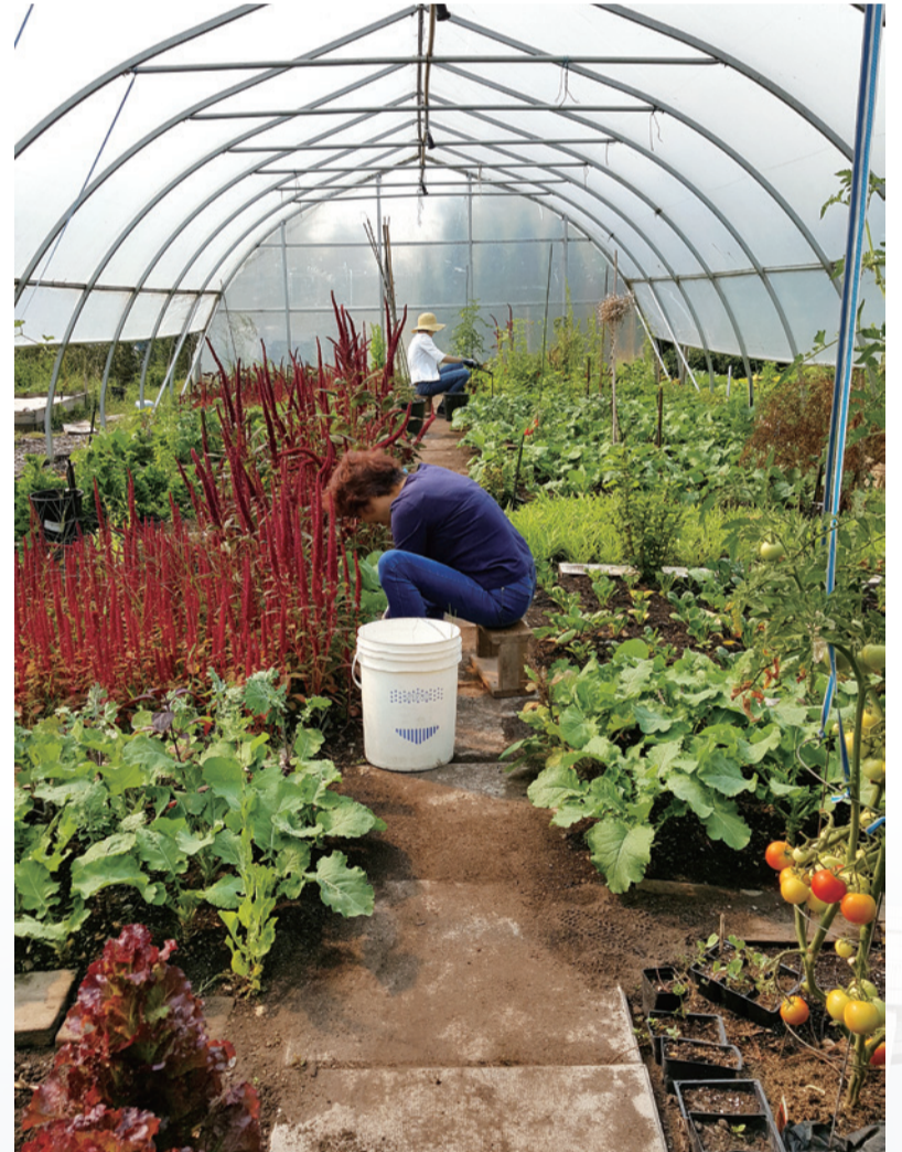
▲ Every Wednesday morning, volunteers regularly work in the garden until noon.

Someone might think farming should not be what students go all the way from Taiwan to Canada for. Well, I had exactly the same idea. However, by the end of this trip, I had a very different perspective: I can practice Buddhist teachings as long as I am mindful and dedicated to whatever I am doing. What matters is not what I am doing but HOW I am doing it.