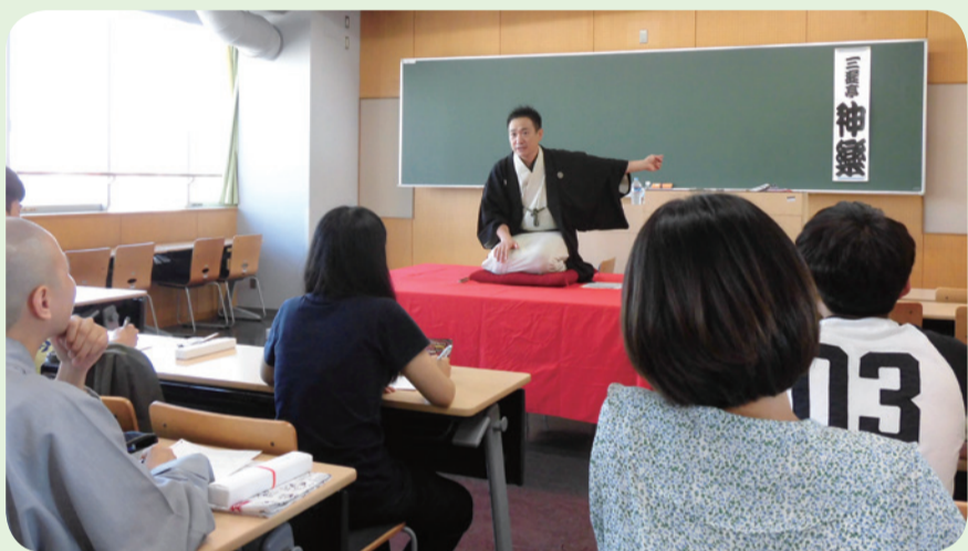
▲ 落語家現場表演。（落語是日本的一種傳統表演藝術）