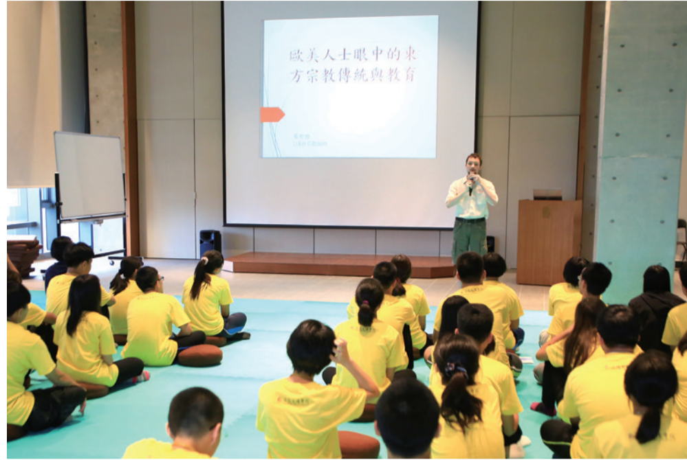
▲ Summer Camp lecture.

Many Taiwanese people assume that the majority of Westerners are born and brought up in the Christian faith. While this is not an unreasonable assumption, nothing could be further from the truth. According to recent surveys, around 60 percent of people in my home country of France consider themselves non-religious. In most other Western European countries, the numbers are similarly high, with 54 and 40 percent of people in the UK and Germany respectively describing themselves as non-religious. The number of unbelievers grows even higher when one considers only the younger segments of the population. Across the Atlantic, Americans remain significantly more religious than their European counterparts. Yet, surveys have shown similar trends even there, with