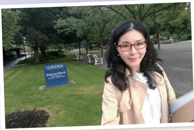
► 筆者奕瓊於新任教的Gonzaga University一隅。