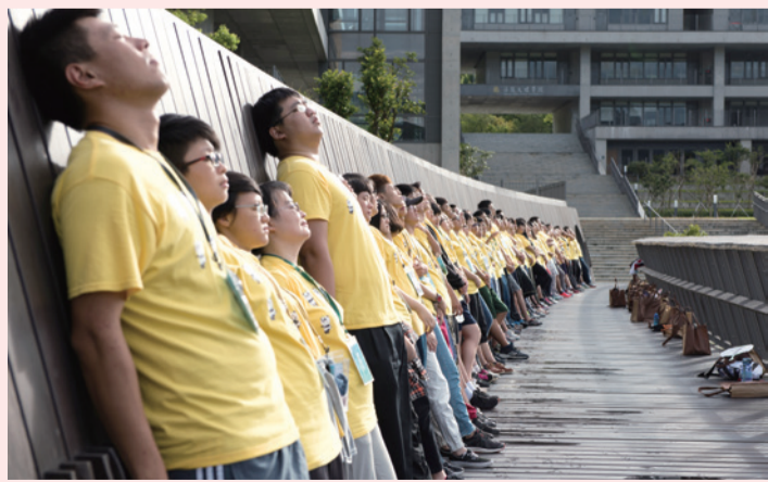
▲晨曦，八式動禪前的放鬆身心。

這場五天四夜豐富的心靈饗宴，感恩內外護義工菩薩、同學們的護持，及全校師生們的支援和成就。佛教學系主任果暉法師在結業式中除了勉勵各位同學，希望今後常與學校聯繫，更歡迎有興趣就讀本校的同學加入「法鼓大家庭」。未來學校將會繼續舉辦暑假高中營，接引更多有志的青年學子，讓我們共同努力期待明年再相會！